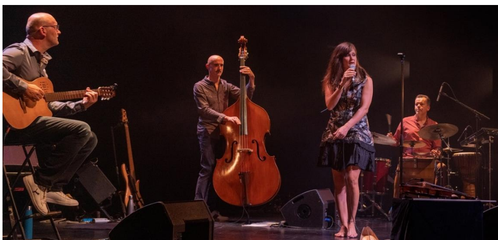
Concert du 23/09/22 au Théâtre Musical de Pibrac (31)

A savoir que les musiques de ce spectacle feront l'objet d'un premier album dont la sortie est prévue avant l'été 2023.