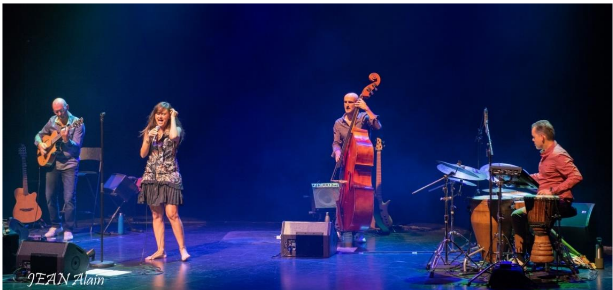
Concert du 23/09/22 au Théâtre Musical de Pibrac (31)